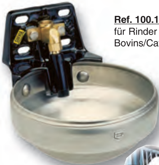
Ref. 100.1200 für Rinder Bovins/Cattle

Anschluss von oben und unten! Raccordement par dessus et par dessous! Connection from above and below!